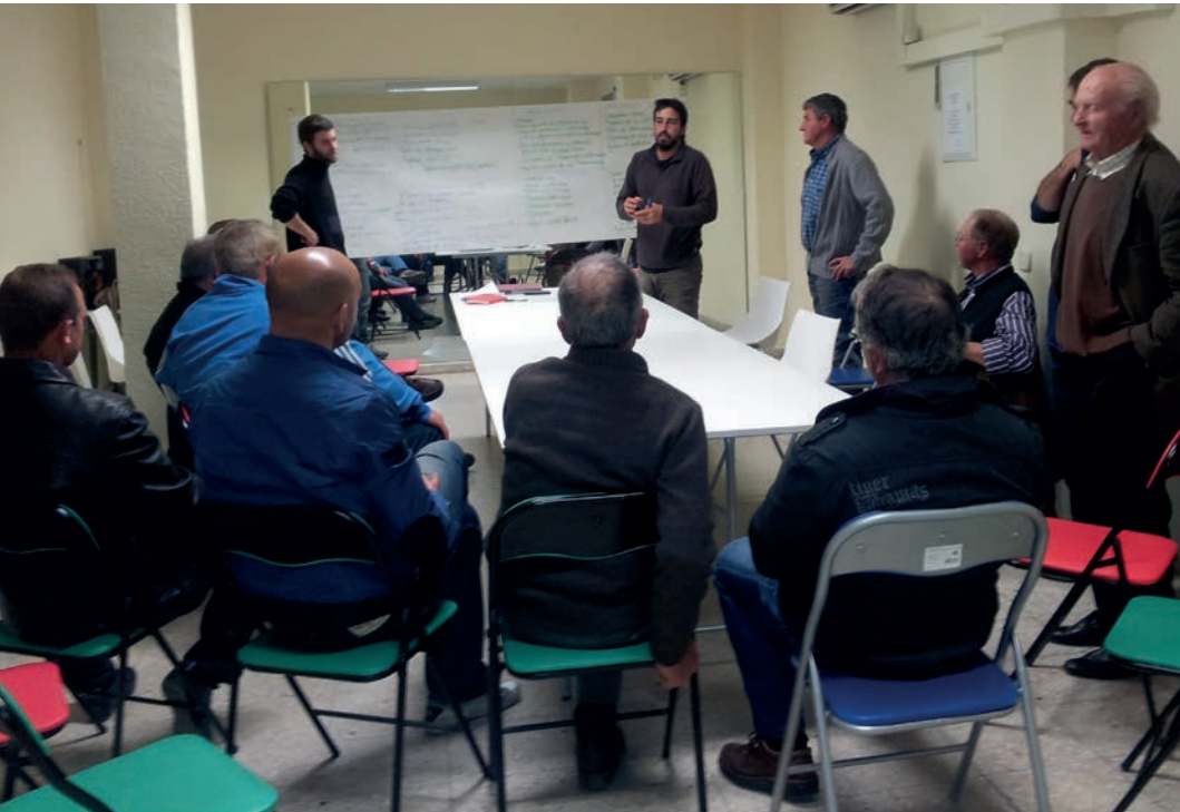
Fotografía: Elaboración del diagnóstico

Para el desarrollo del marco lógico se establecieron una serie de mesas de trabajo, diferenciadas por grupos de afinidad, en las cuales estaban representadas la mayoría de los actores que pueden verse implicados en la consolidación de un Parque Agrario de manera directa o indirecta, y partiendo de la premisa de que cuantos más estén implicados en el proceso mejor.